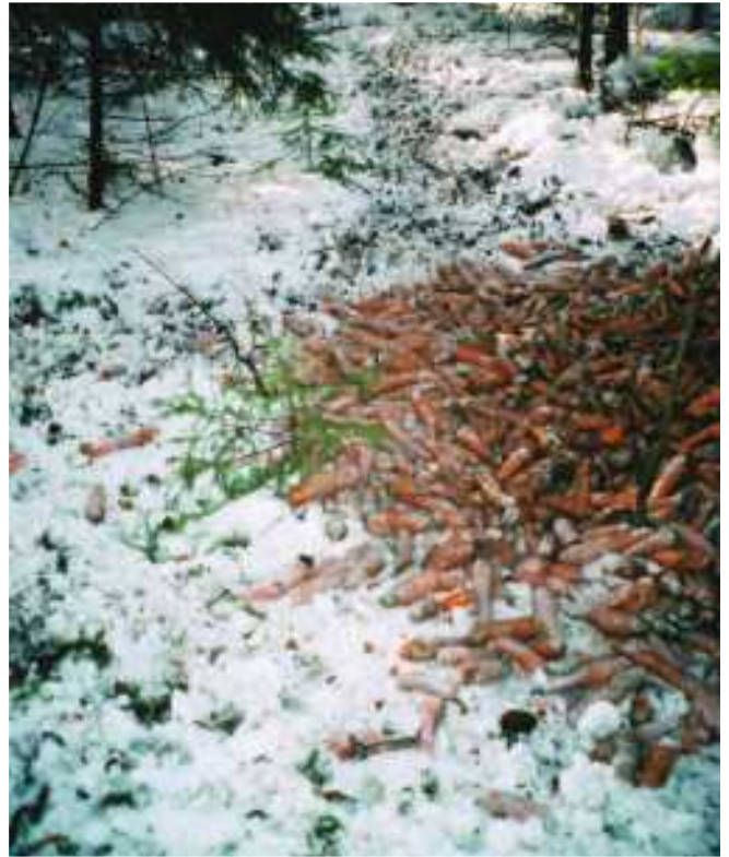
Porkkanat maistuvat peuroille.

Metsien uudistushakkuut ovat viime vuosikymmeninä muuttaneet alueita ja tuoneet ruokaa varsinkin hirvieläimille. Toisaalta esimerkiksi peurat tarvitsevat riittävän vanhoja tiheitä kuusikoita viihtyäkseen alueella myös talvisaikaan. Kuten tiedetään, riistakannan vaihtelut johtuvat lajeittain monestakin eri asiasta, mihin riistanhoidollakaan ei aina voi ratkaisevasti vaikuttaa.