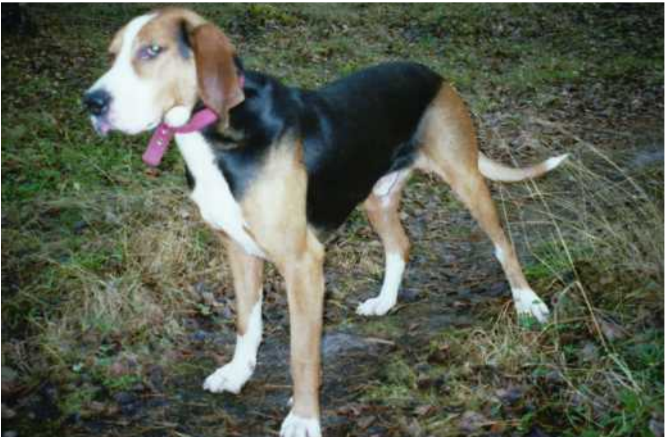
Topi valmiina ajoon.

Kerran ylituomarin tarkastettua arvostelukorttini tuli välillemme kohtelias keskustelu jostain sääntöjen kohdasta minkä mielestäni varmasti tiesin oikein. Ylituomarin punoitus alkoi vähitellen laajeta keskustelun myötä. Kun pyysin sitten merkintää palkintotuomarikorttiini, jossa oli pitkä rivi ryhmänjohtaja merkintöjä, kirjoitti ylituomari siihen -varatuomari- ja lätkäisi kortin käteeni. Huumorimielellä siinä erottiin, ja tappaus aina joskus hauskana muistuu mieleen.