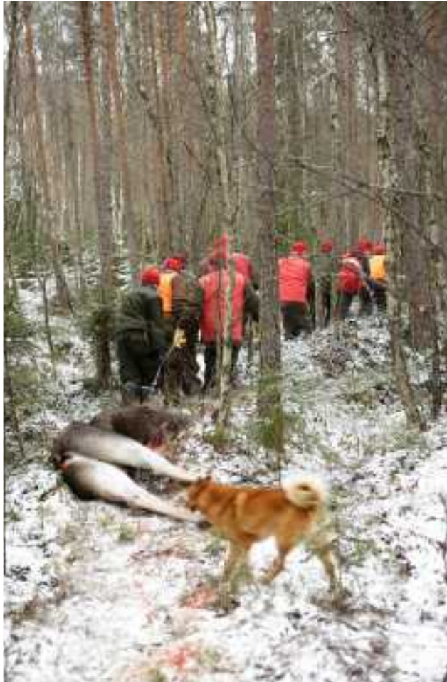
Kauden viimeinen hirvi.