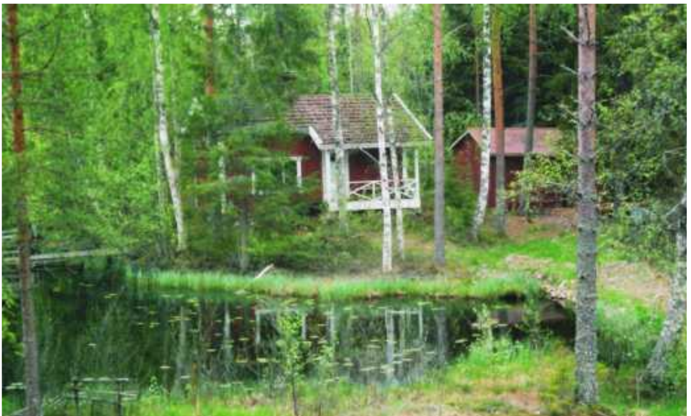
Metsolan sauna.