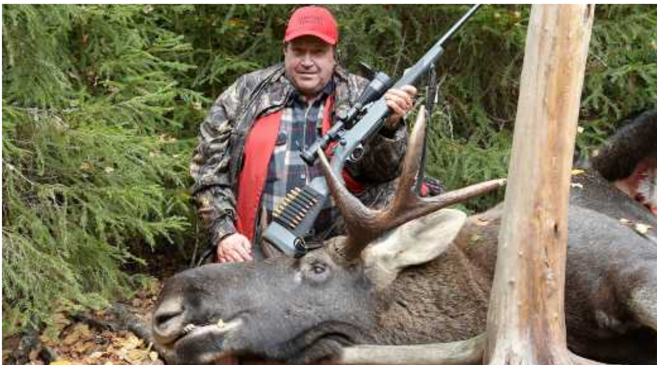
Kaataja, kaadettu ja Sakon 9.3x66.