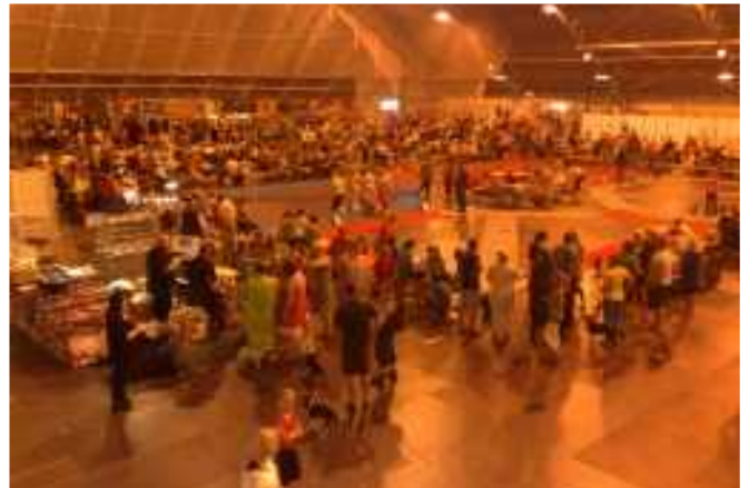
Porin kansainvälinen koiranäyttely 2010 Porin Karhuhallissa ja ulkokehissä.

Porin kansainvälinen koiranäyttely 2010 järjestettiin Porin Karhuhallissa ja sen ympäristössä 3.-4.7.2010. viiden yhdistyksen voimin, jotka olivat Porin Metsästysseura ry, Porin Palveluskoirakerho ry, Porin Kennel-Kerho ry, Satakunnan Dreeverikerho ry ja Satakunnan Kanakoirayhdistys ry. Porin Metsästysseuralla on harvinaisen pitkä historia koiranäyttelyiden järjestämisessä ja perinnettä tullaan jatkamaan.