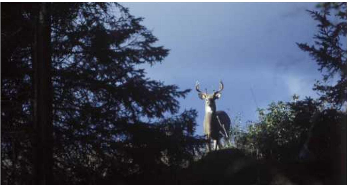
Maiseman vahti.

Muutaman metrin päässä, hakkuulta säästyneen riukumännyn kuivalla alaoksalla hömötiainen kallistelee päätään ja hiukan kai ihmettelee ihmisen touhuja.