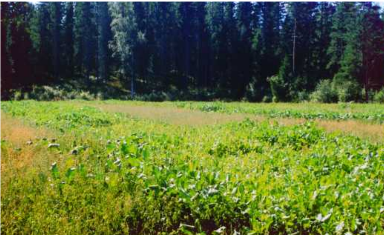
Riistapelto hyvässä kasvussa Sirpa ja Timo Lehtikankaan mailla.