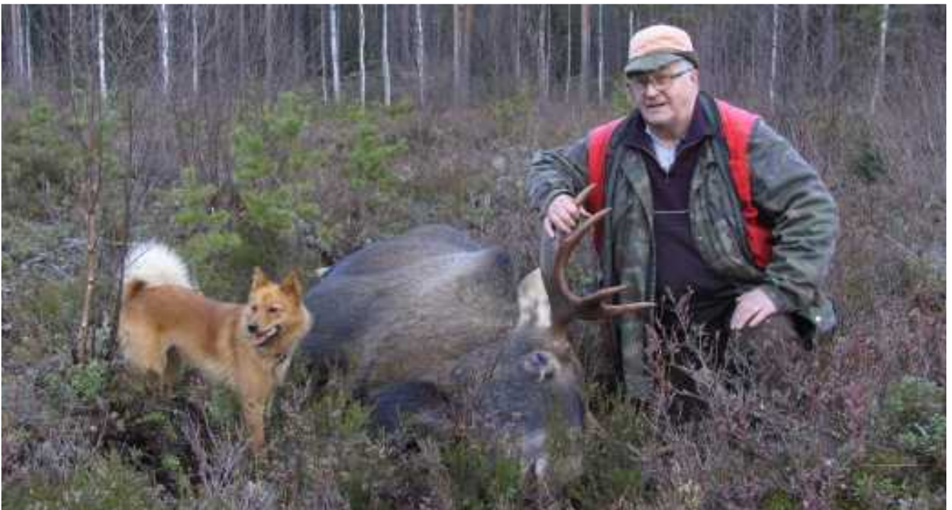
Ollin kaato.