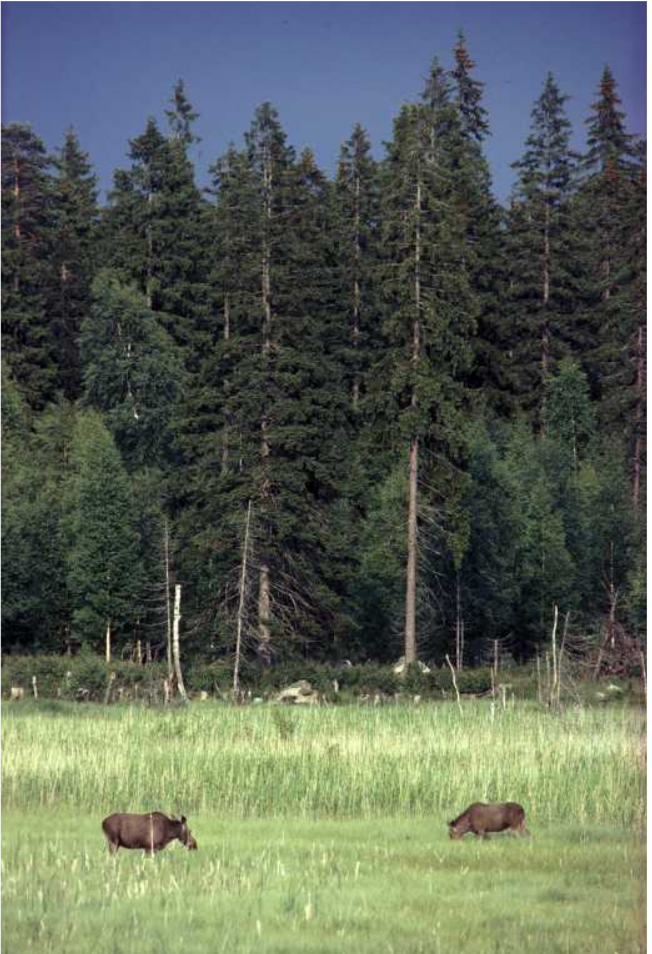
Hirvet ja ukkospilvi.