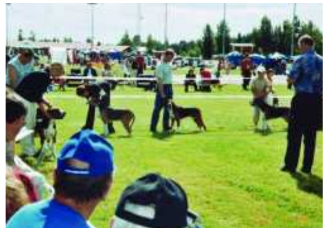
Suomenajokoirakerhän laidalla.

vuonna 2004. Dreeverien ajokokeen keskuspaikak-si Metsola varattiin vuonna 2003. Marko Taimi on järjestänyt Metsolan maastoihin metsästyskoirien jäljestyksoikeudet vuosina 2002 ja 2003.