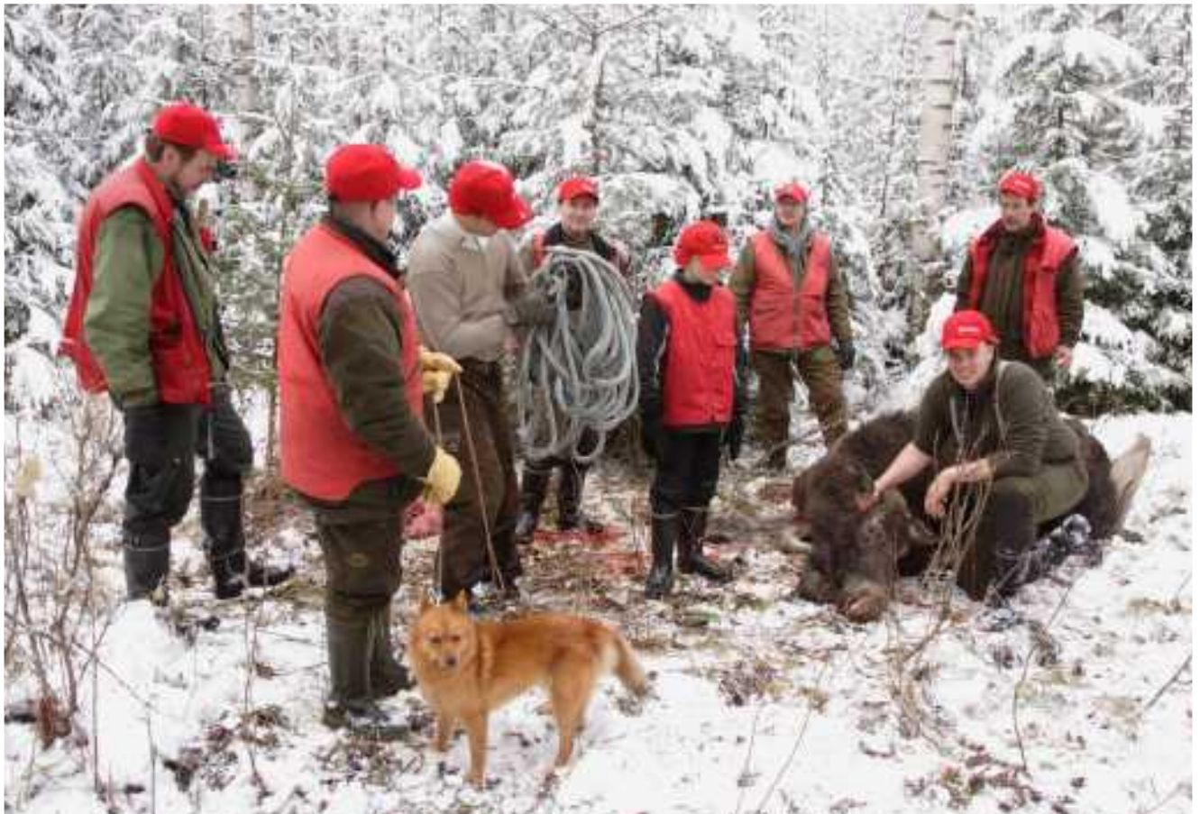
Jaakon kaato.