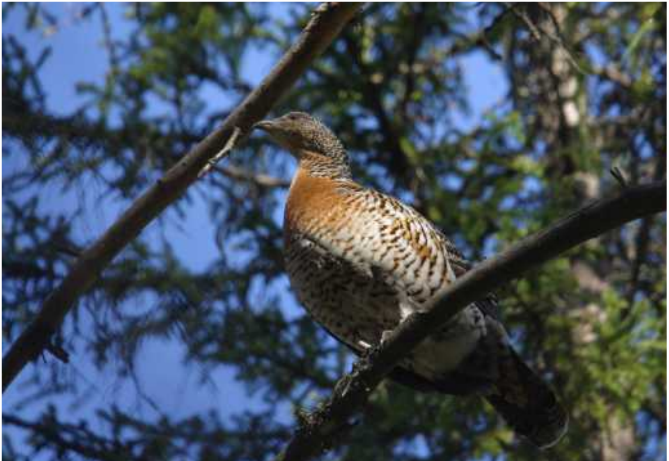
Koppelo koiran näkökulmasta.