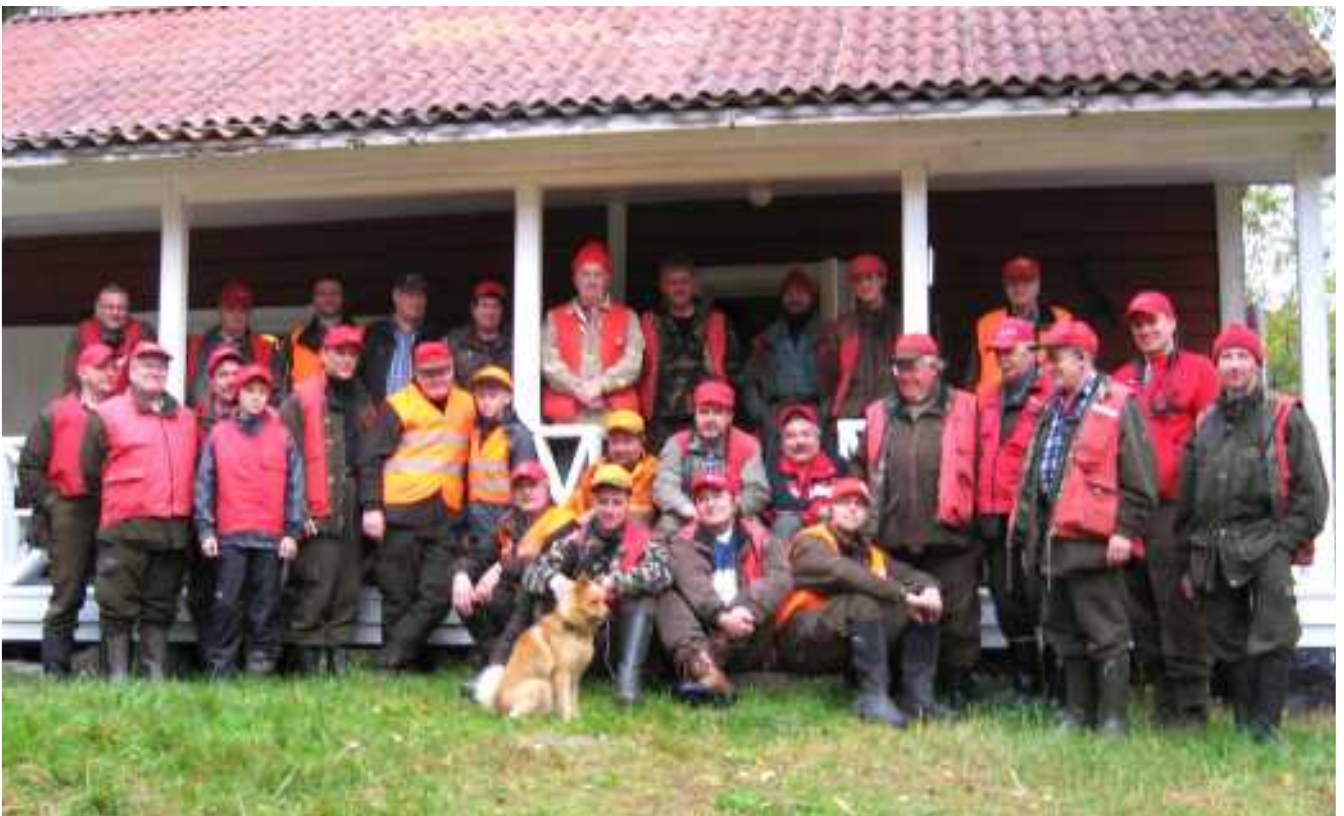
Hirvimiesten yhteiskuva.