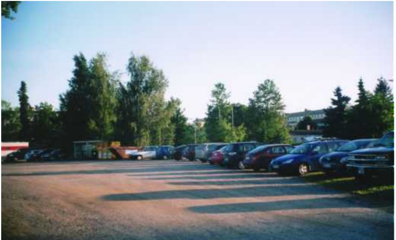
Ilta saapuu Herralahden pysäköintialueelle PMS:n pysäköinti- ja siivoustalkoiden jälkeen.