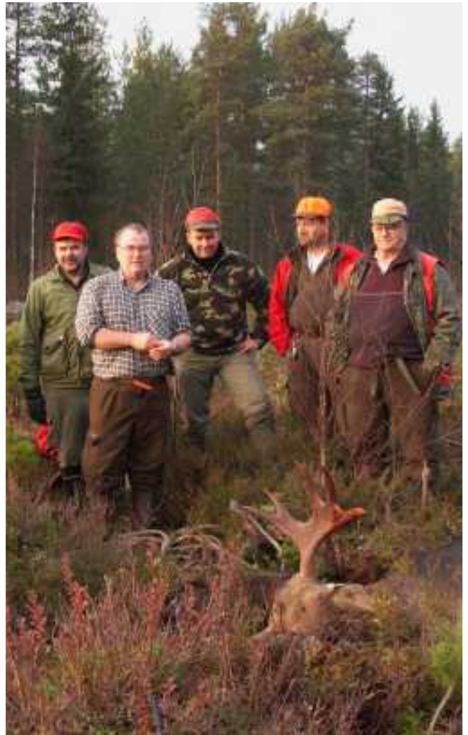
Kaadolla.