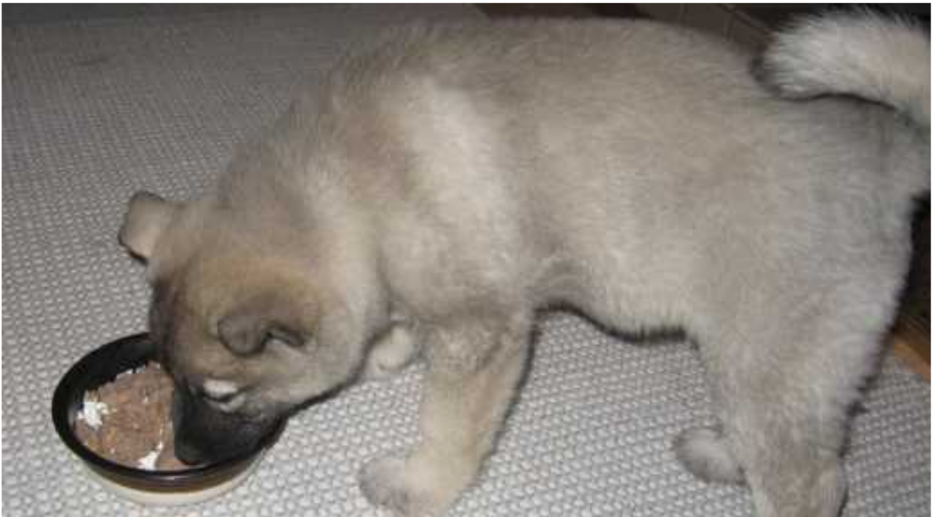
Karvisen perheessä kasvaa hirvikoiranalku Dino.

Hyviä jahtireissuja jatkossakin kaikille koiramiehille ja passimiehille samoin.