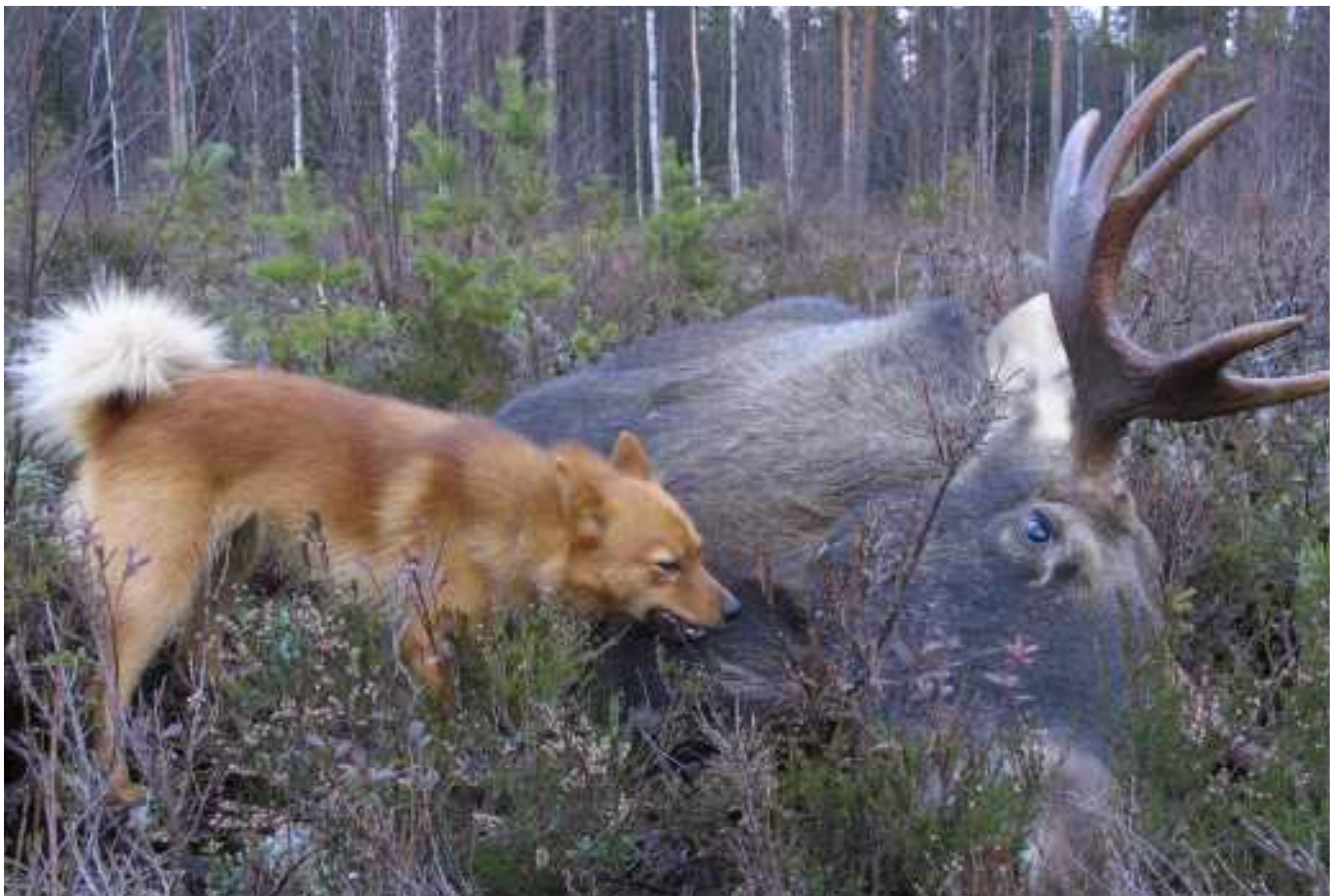
Ansaittu saalis.