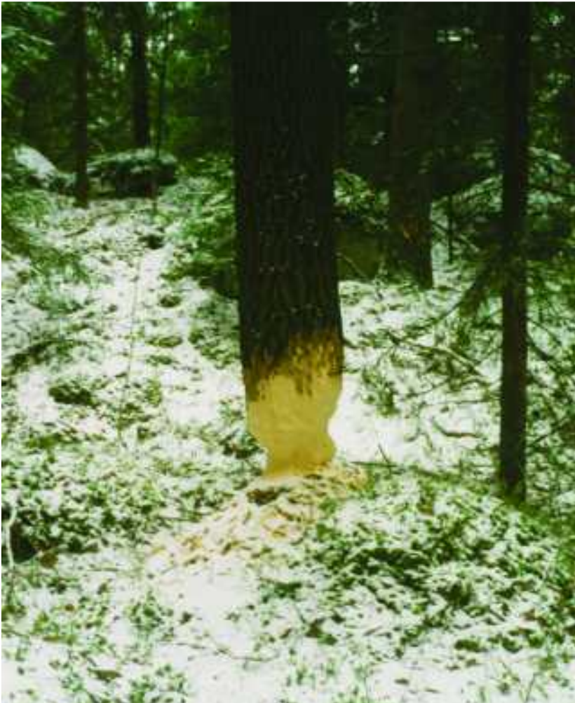
Majavan työmaa.