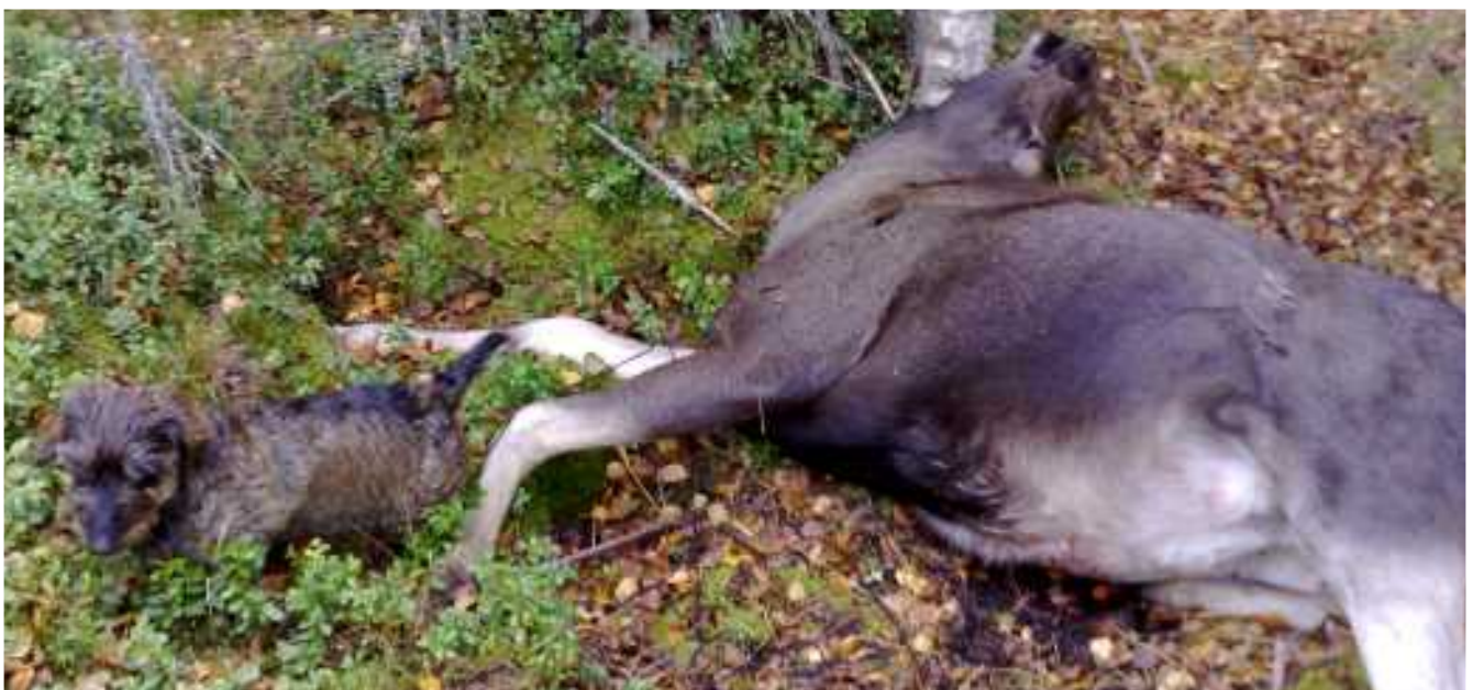
Nita ja vasa.

”Metsola maastoineen soveltuu erinomaisesti MEJÄ-kokeen pitopaikaksi. Maastot ovat koirille haastavat, jopa vaikeat, minkä molempien kokeiden tulostasotkin osoittivat (toki kokeet olivat kevään ensimmäisiä). Paikasta ja pienimuotoisen kokeen loistavasta ilmapiiristä johtuen sain seuraavana vuonna useita yhteydenottoja, joissa kysyttiin että järjestääkö PMS tänä vuonna MEJÄ-koetta... Toivottavasti siihen vielä tulevaisuudessa on mahdollisuuksia”