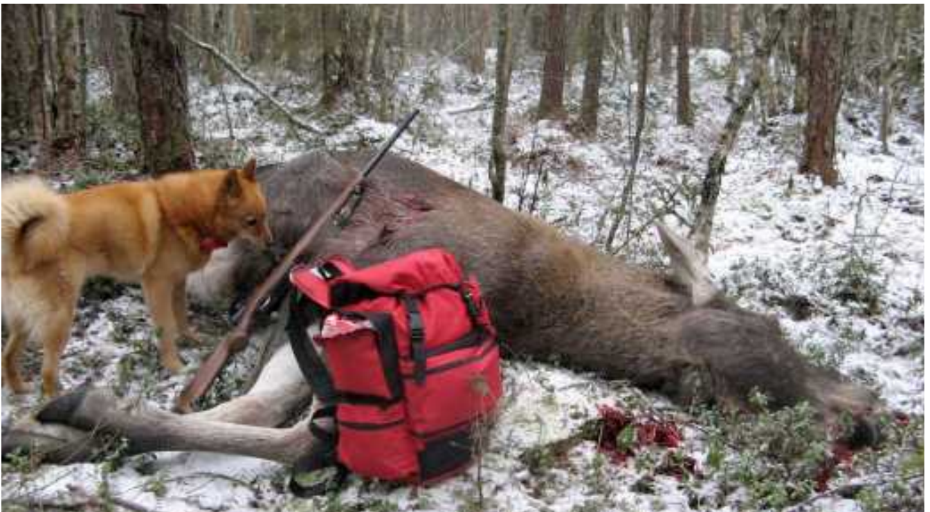
Nilla ja pankkhirvi.

Olen varma, että hirvi on kuullut tuloni ja nyt valmiiksi varuillaan oltuaan pakenee haukkuvan koiran tieltä pois päin aiheuttamistani äänistä. Rytinä alkaa kuitenkin kaikkoamisen sijasta lähetä; ei siirry edes mitenkään sivulle, vaan tuntuu tulevan aika lailla kohti. Reilu kymmenen metriä edessäni on näkemisen esteenä hiukan joulupuuta vauraampien kuusien tihukko, ja vain sen oikeassa laidassa on yksi vähäinen katseenmentävä aukko takana olevaan maastoon.