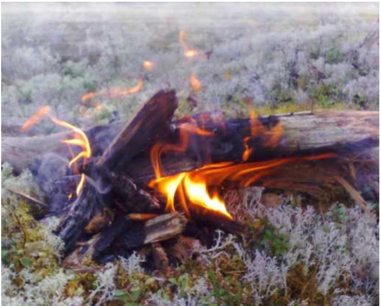
Rounaskallion tuli.

Kun olen poissa vie tuuli tuhkani metsiin aamunkosteille varvulle oksille puiden ja olen taas kotona