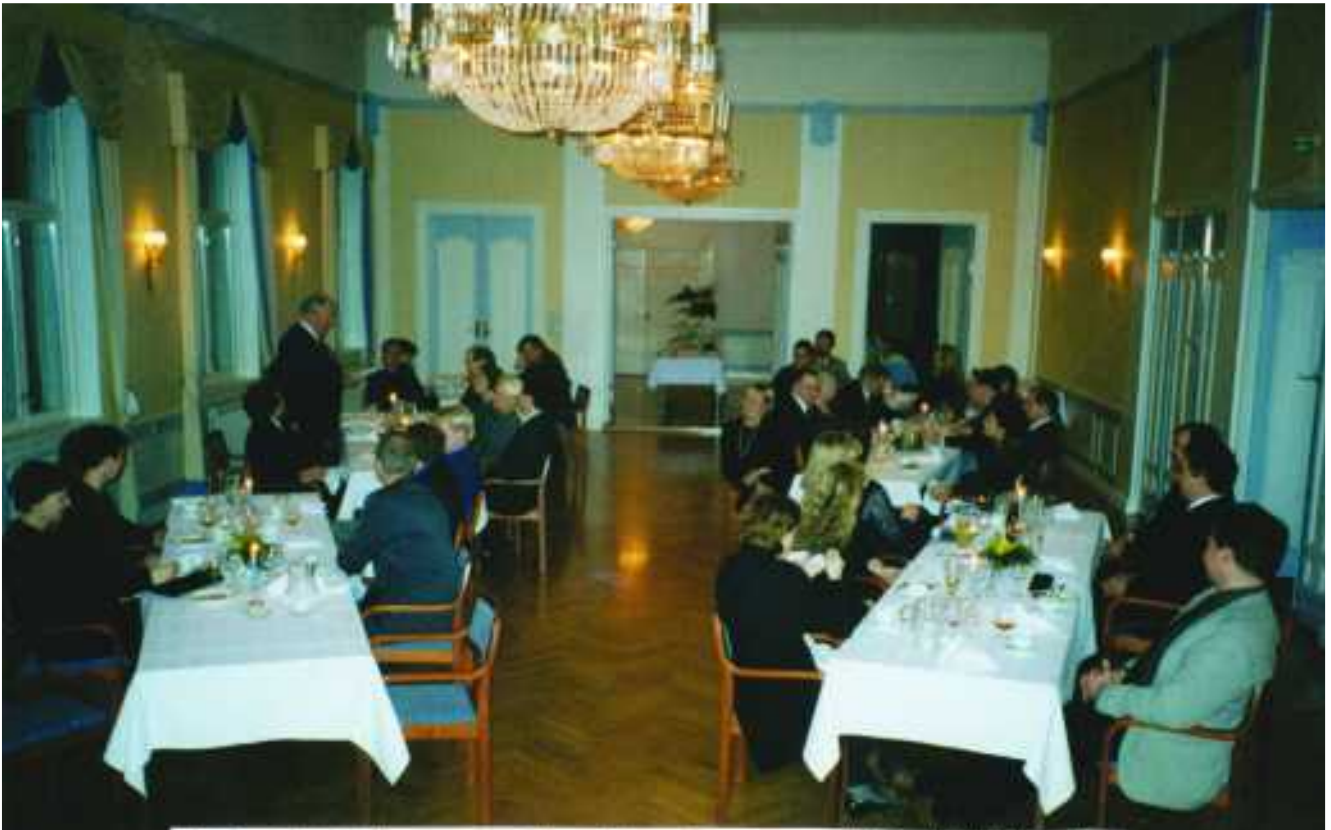
Porin Metsästysseuran jäseniä puolisoineen yhteisellä illallisella Porin Suomalaisella Klubilla vuonna 2000 seuran täyttäessä 110 vuotta.