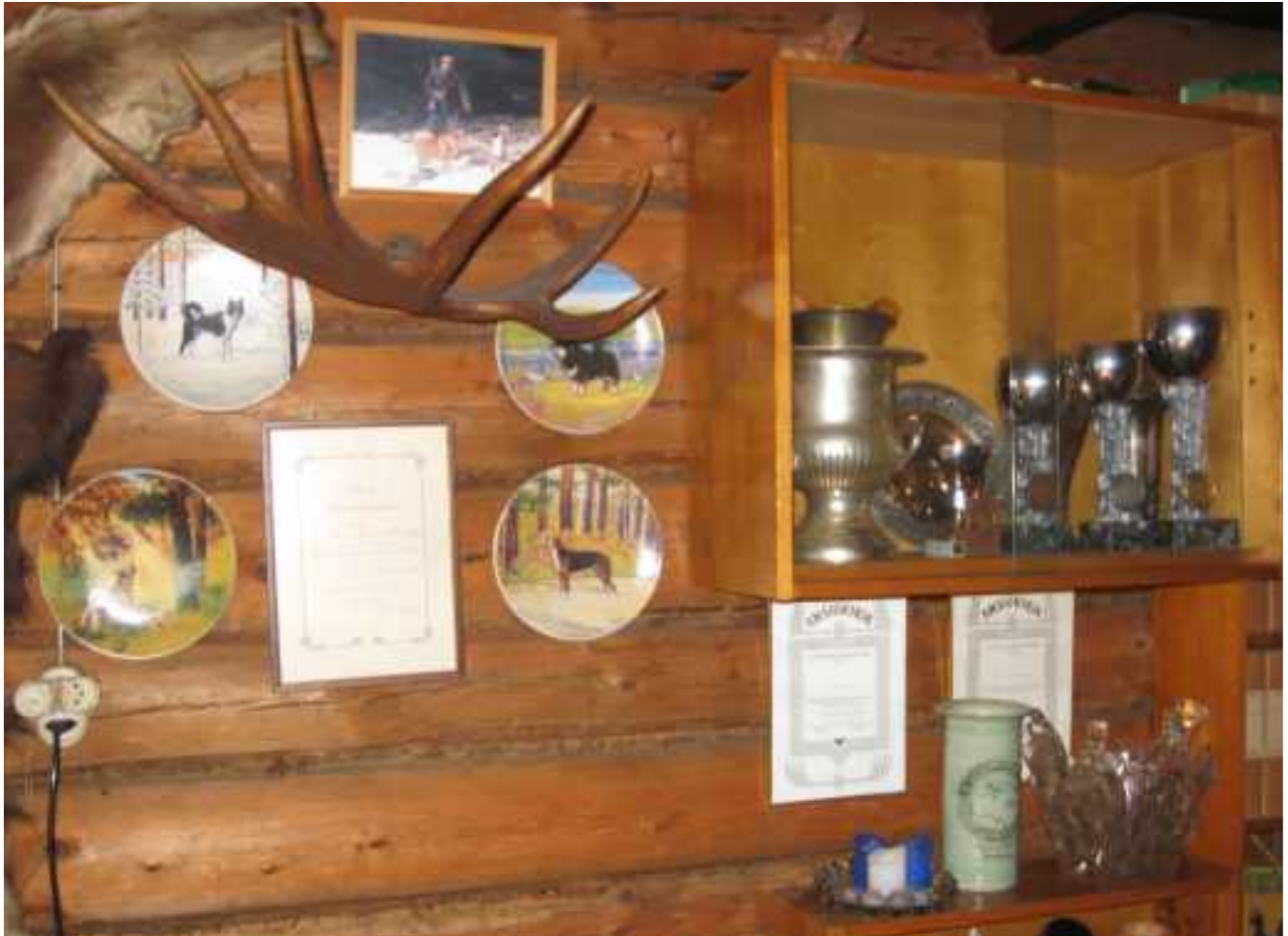
Metsolan pokaalikaappi.