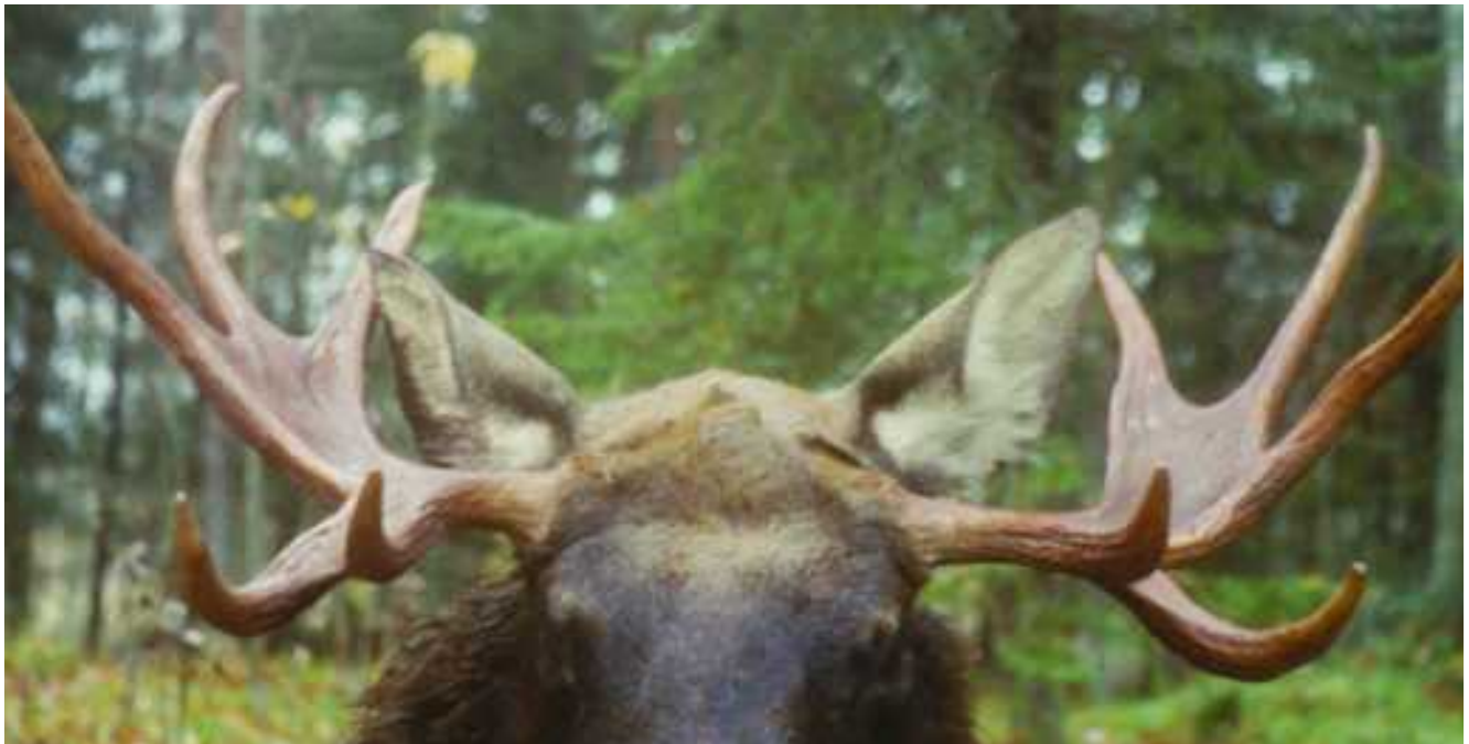
Vanha sarvipää.

Viime syksynä kun jahti alkoi, alueelta lähti liikkeelle kuuden hirven lauma ensimmäisessä vedossa. Timon mailta riittää muistorikkaita jahtikokemuksia.