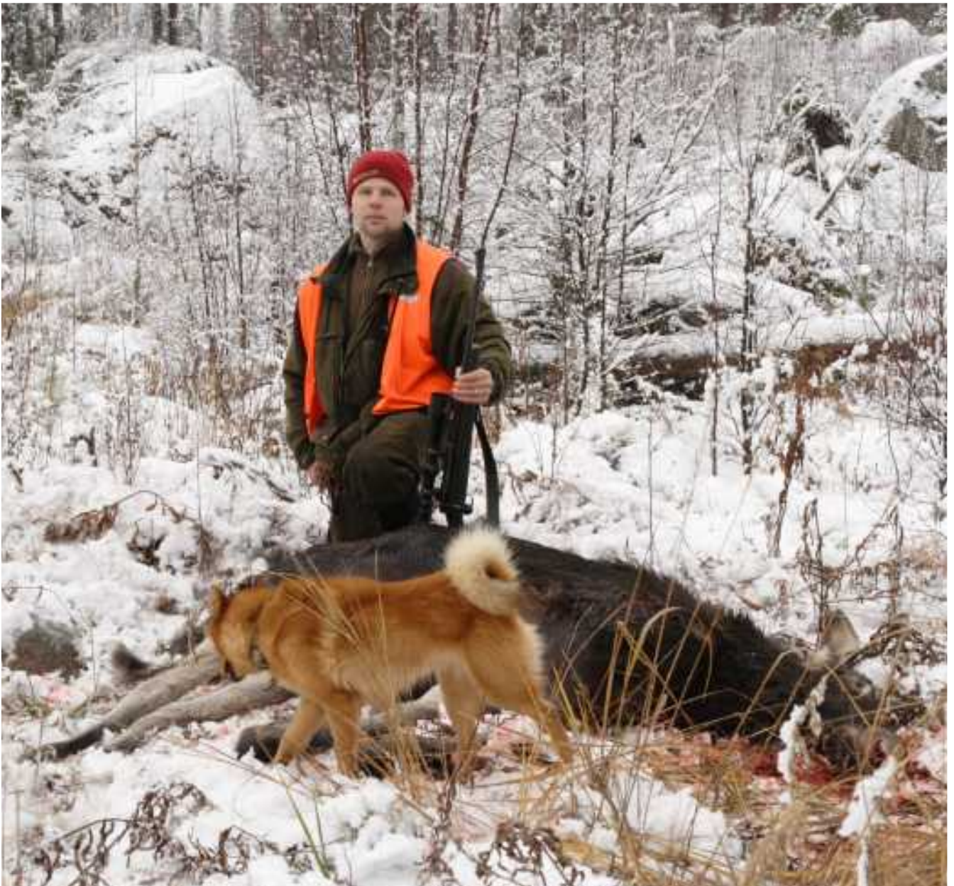
Martti kaadolla.

Hetkessä kaikki on ohi. Puiden välistä näen hirven kaatuvan. Metsäveri suonissani viilenee hie- man ja lausun hiljaisen kiitoksen.