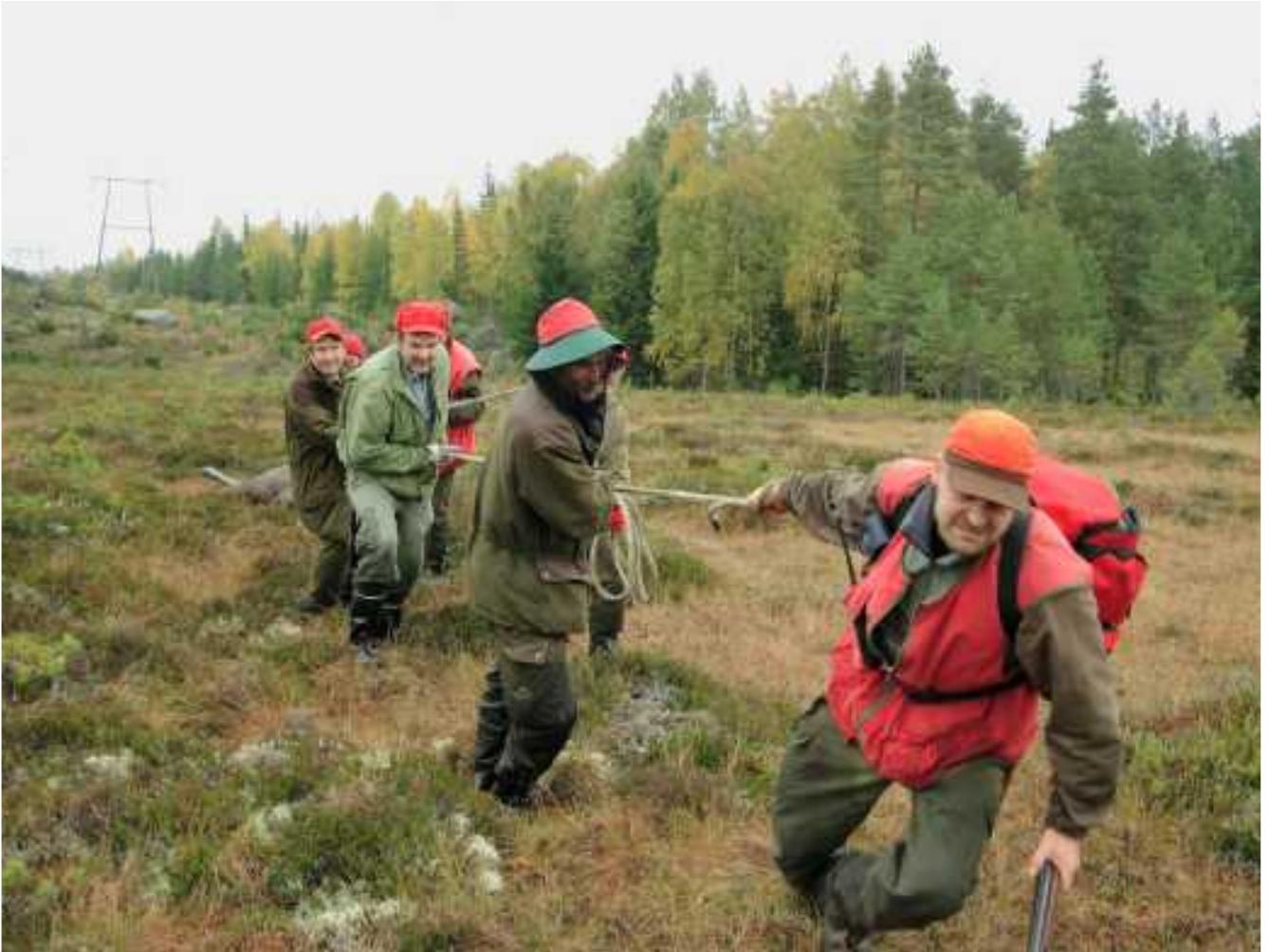
Linjasuon veto.