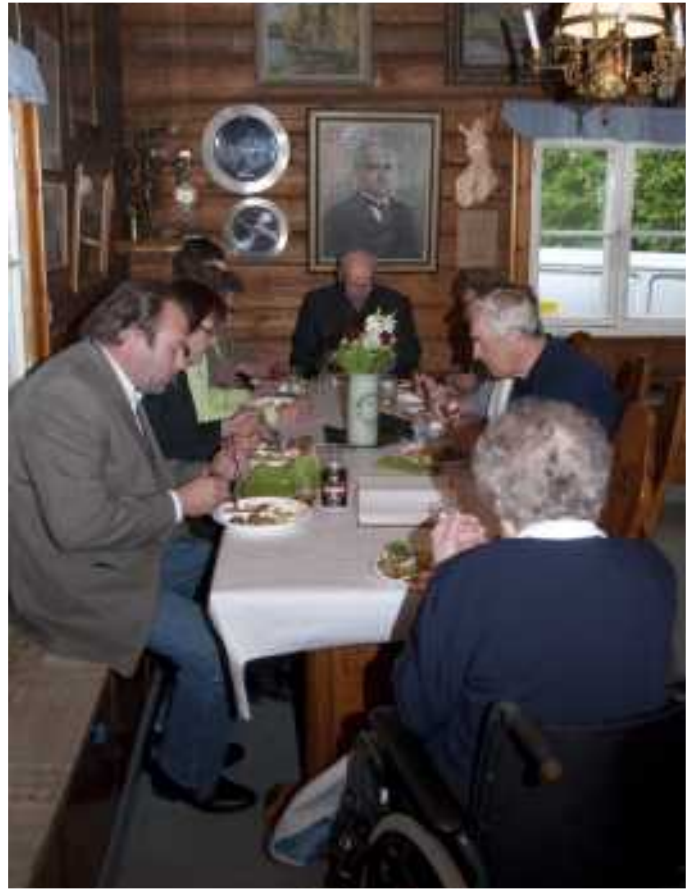
Maanomistajia ja naapuriseurojen edustajia Metsolassa.