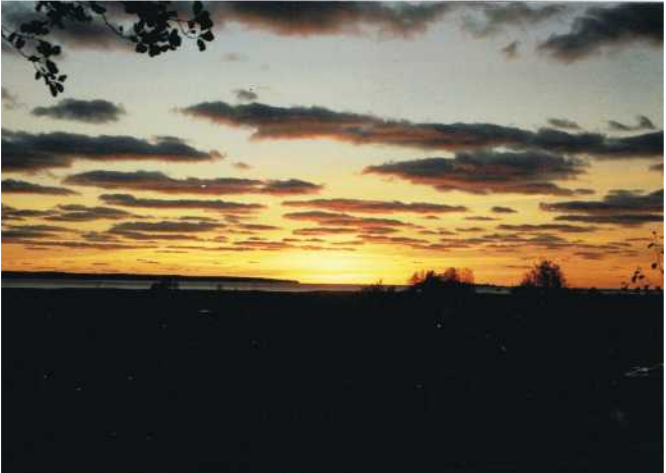
Ilta näkymä sorsajahdissa.

Lopulta pilvet väistävät ja valo painuu maille. Auringon kultainen silta vaihtuu kuun kalpeaan hehkuun. Käännyin vielä kerran katsomaan hämärän peittämää merta, hiljaa kunnioittaen.