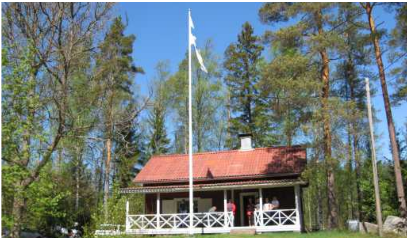
Metsola keväällä 2009.

Iso-Löytyn länsiosan vesialue, noin 0,9 ha Metsolan edustalla on liitetty seuran omistamaan Levola-nimiseen kiinteistöön minkä kokonaispinta-ala on nykyisin 7,82 hehtaaria.