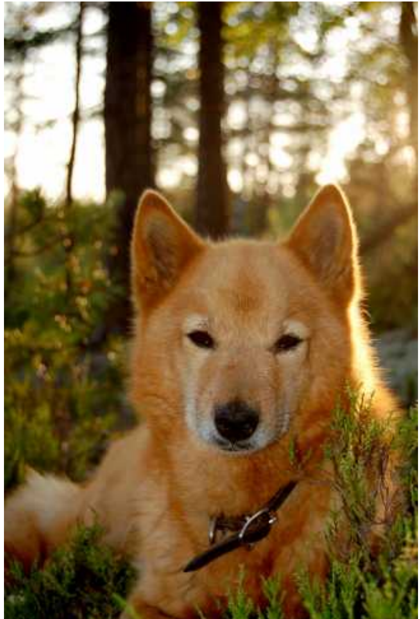
Nilla Rounaskalliolla kesäkuussa 2009.

Auringon laskeutua kesäkuun 28. päivänä vuonna 2009 parantumattomasti sairastunut Nilla kuoli pyytökoiran arvolle sopivasti omilla jahtimaillaan Rounaskallion laella. Samaan paikkaan on pari vuotta aiemmin hyvin kuulunut pankkihirven haukku nelisensadan metrin päästä.