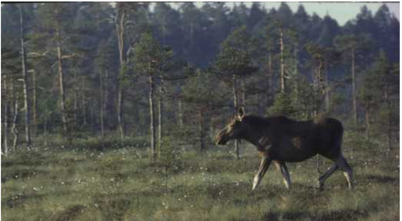
Hirvi suolla.