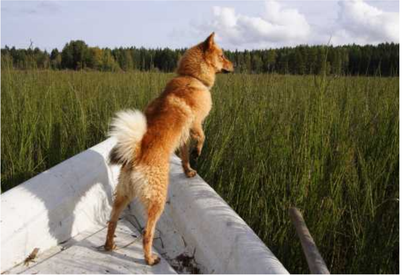
Nipsu sorsanpyynnissä.