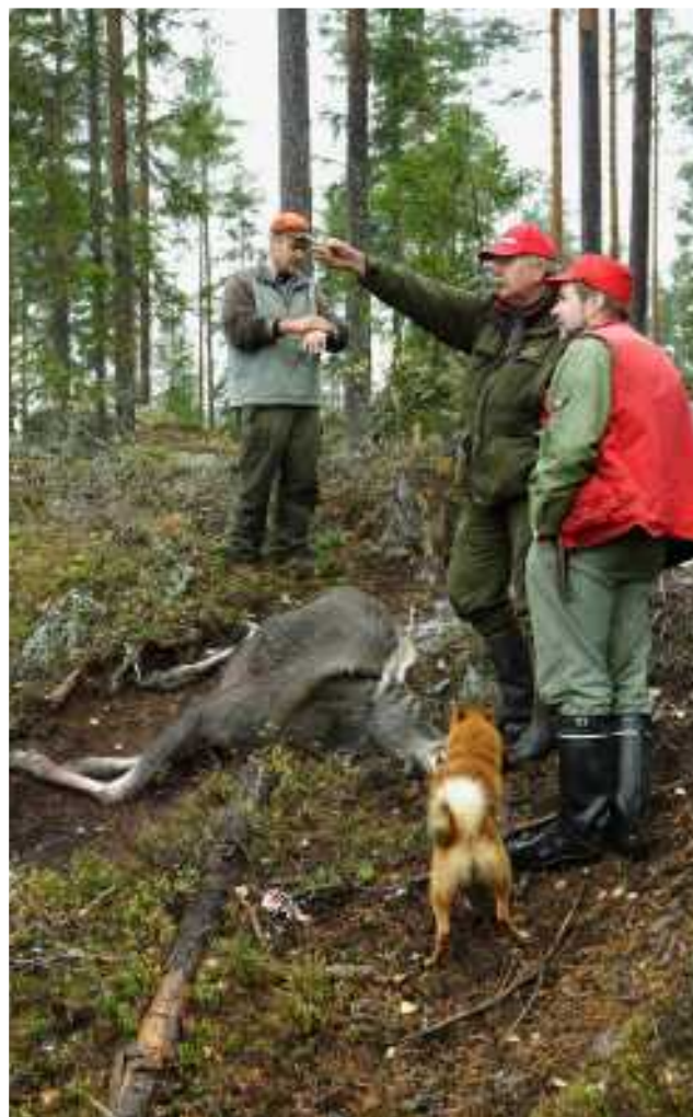
Tuolta se tuli.