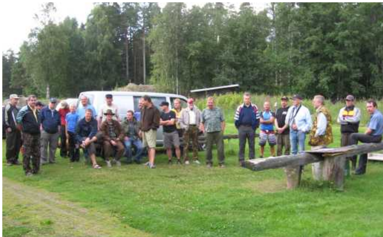
Kolmen seuran ampumakilpailut Noormarkun ampumaradalla vuonna 2009.