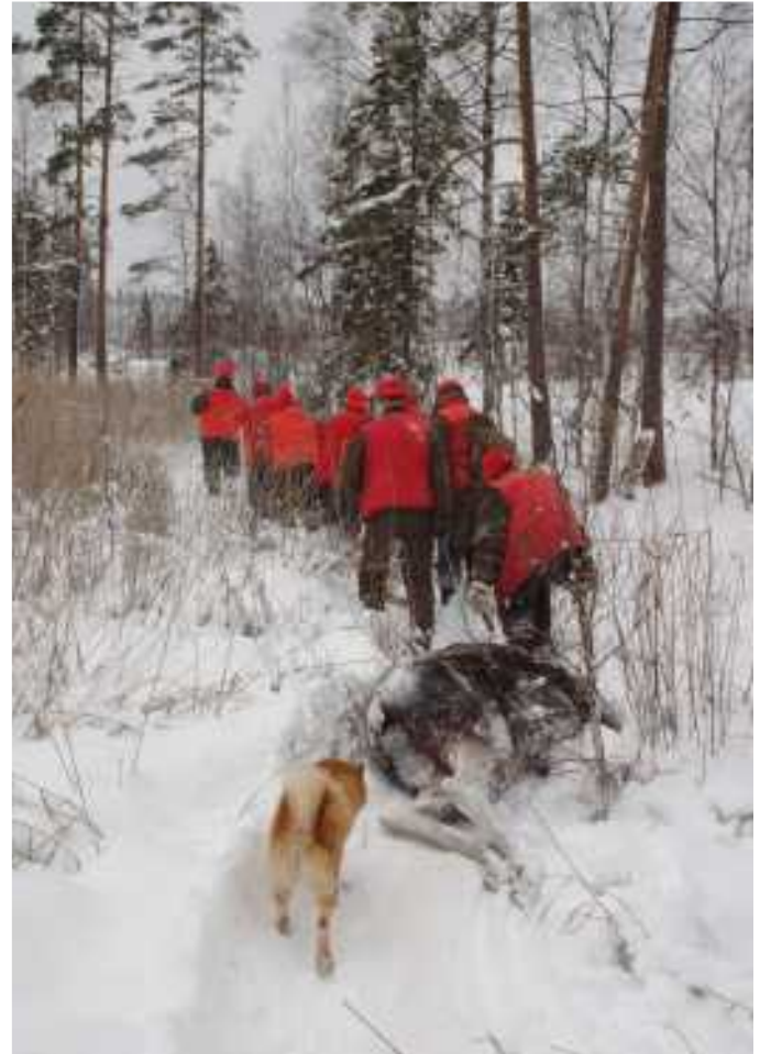
Lumikelillä Invatnassa.