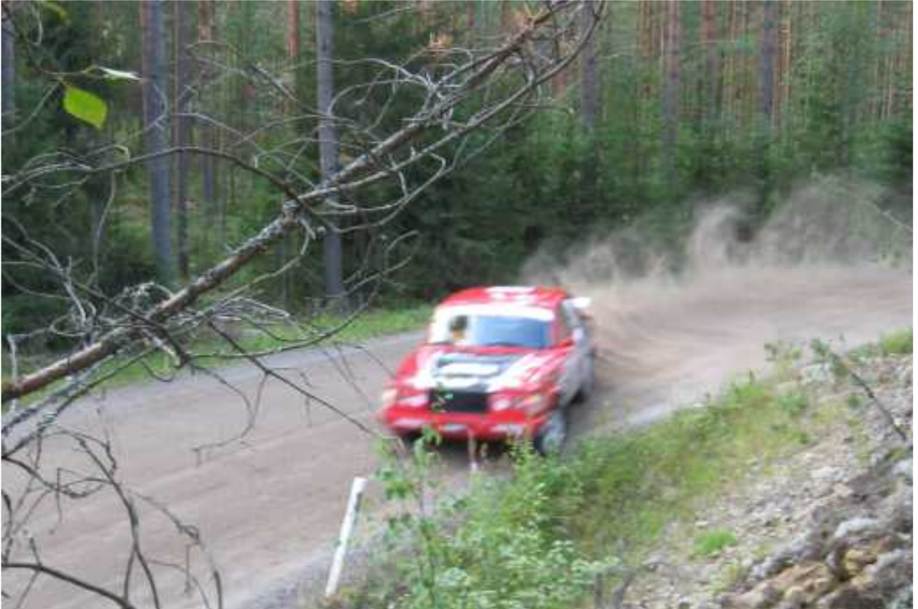
Rallivauhtia Kivirannantiellä vuonna 2009. Porin Metsästysseura avusti järjestelyissä