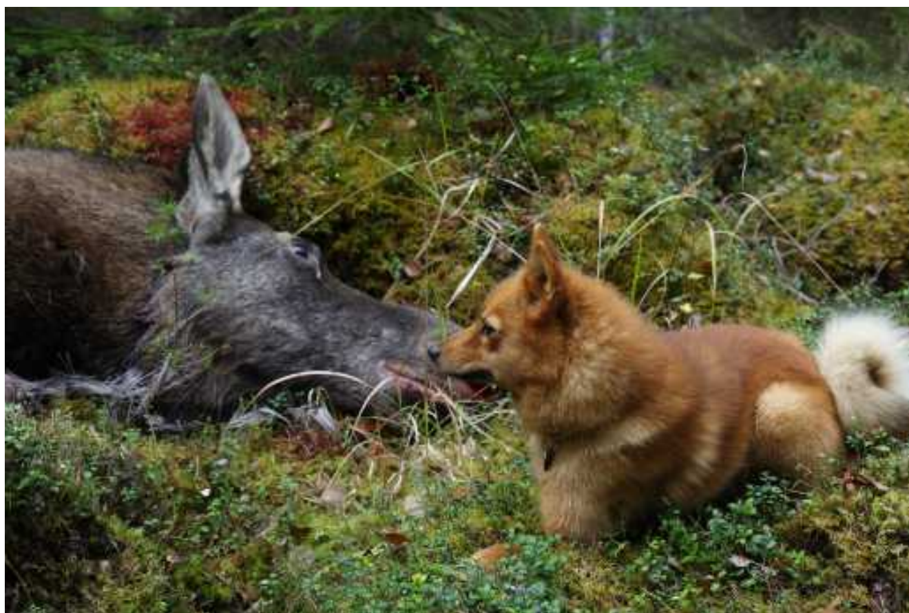
Haukun päätös.