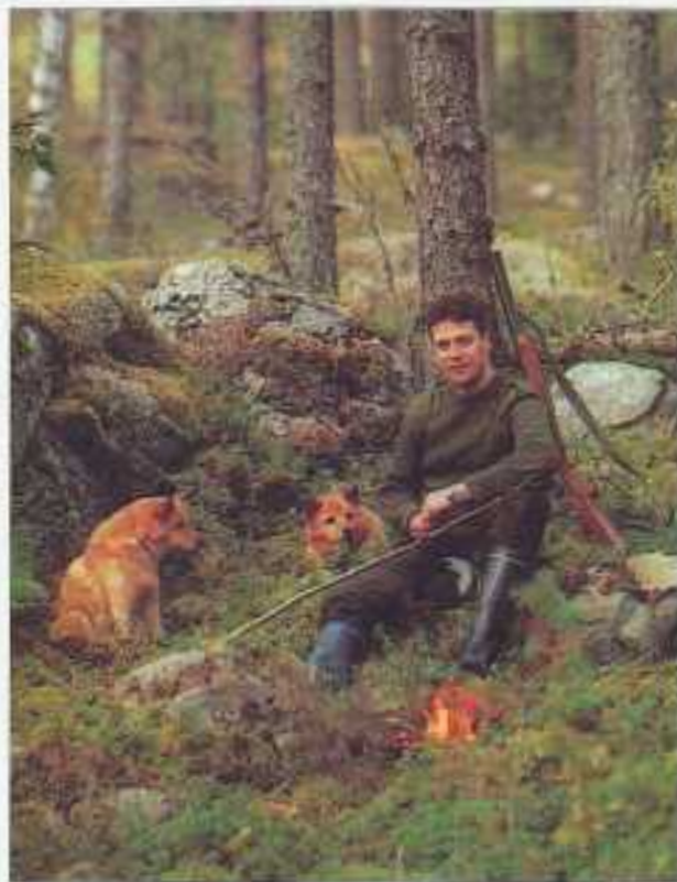
Seuran jäsenillä on aina ollut hyviä metsästyskoiria. Kuvassa seuran sihteeri pystykorvineen.

Alekirjoittaneella on ollut mahdollisuus perehtyä hirvijahtiin seuran metsästyksenjohtajana jo 25 vuoden ajan. Jahtiporukan vahvuus on tuona aikana vaihdellut muutamasta miehestä 25:een. Mieleenpai-