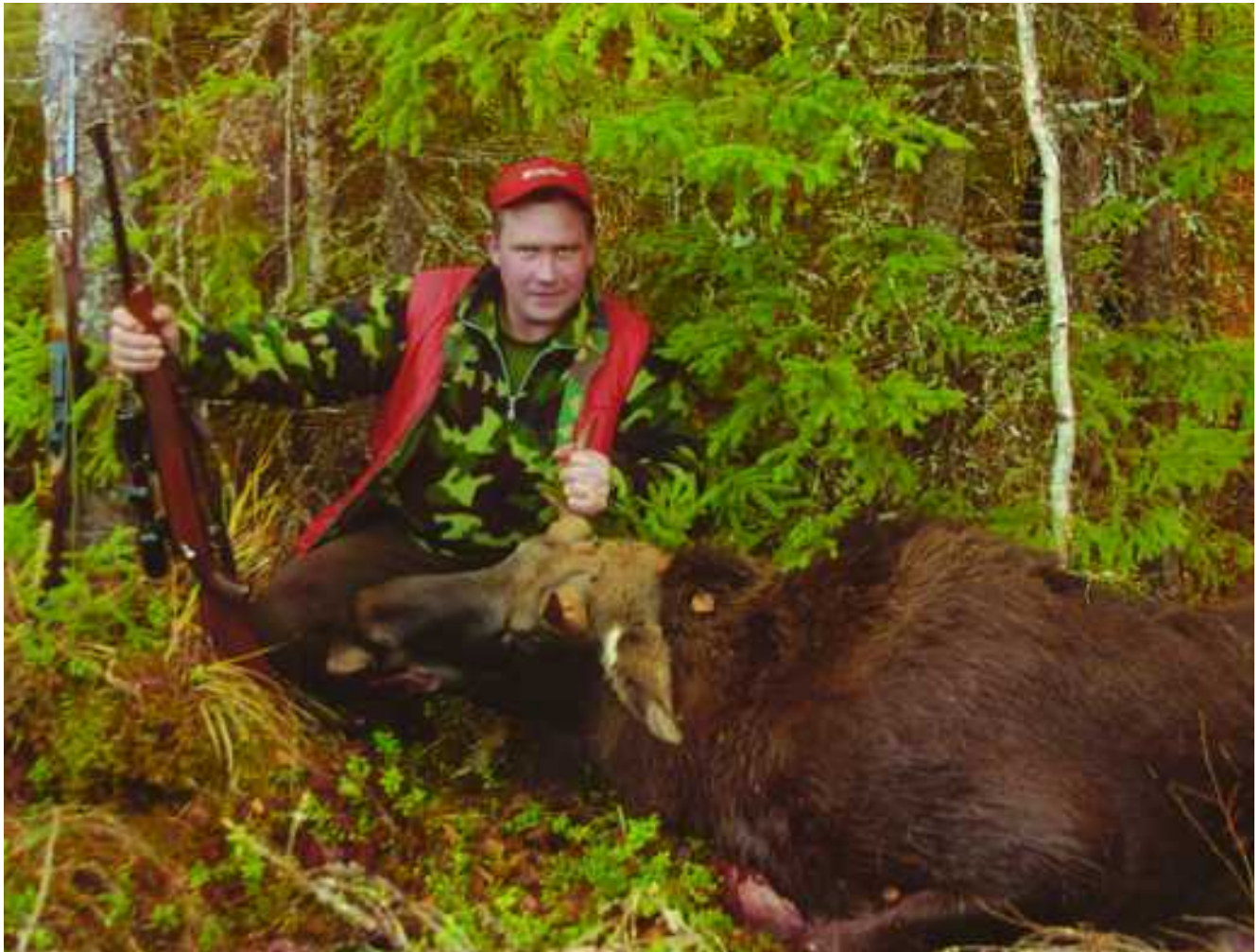
Lassin kaato.

Laukauksen kaiku kiiri Pröttikorven yllä. Ajomiehet pysähtyivät. Hetken kuluttua kuuluivat myös merkkilaukaukset. Hyvinhän se meni.