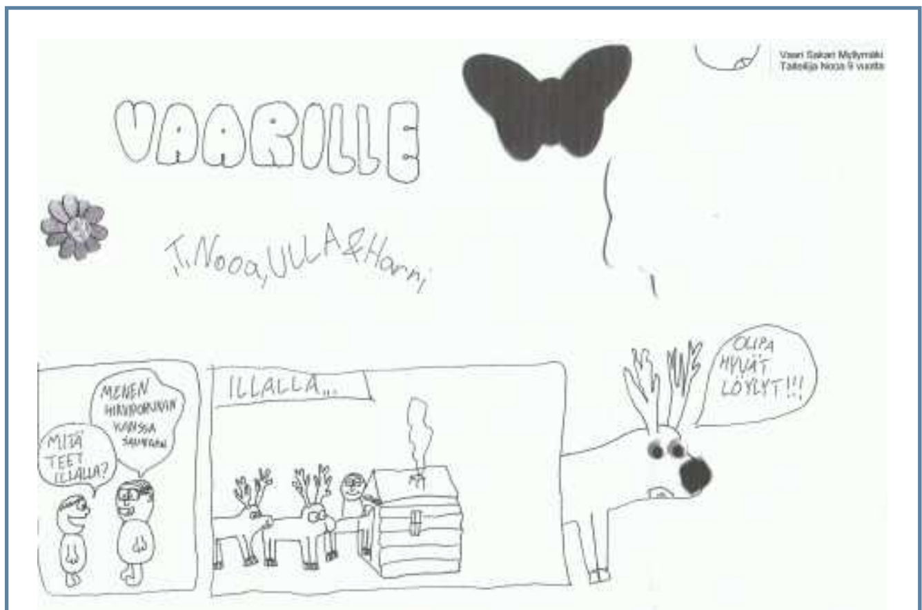
9-vuotiaan Nooran piirustus Sakari-vaarille.