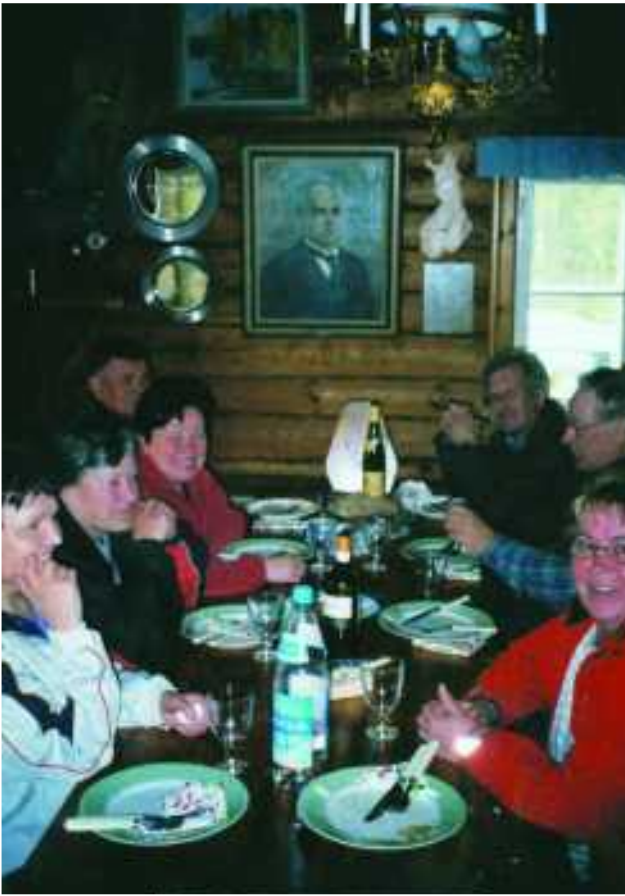
Metsola-päivää viettämässä perheen voimin.