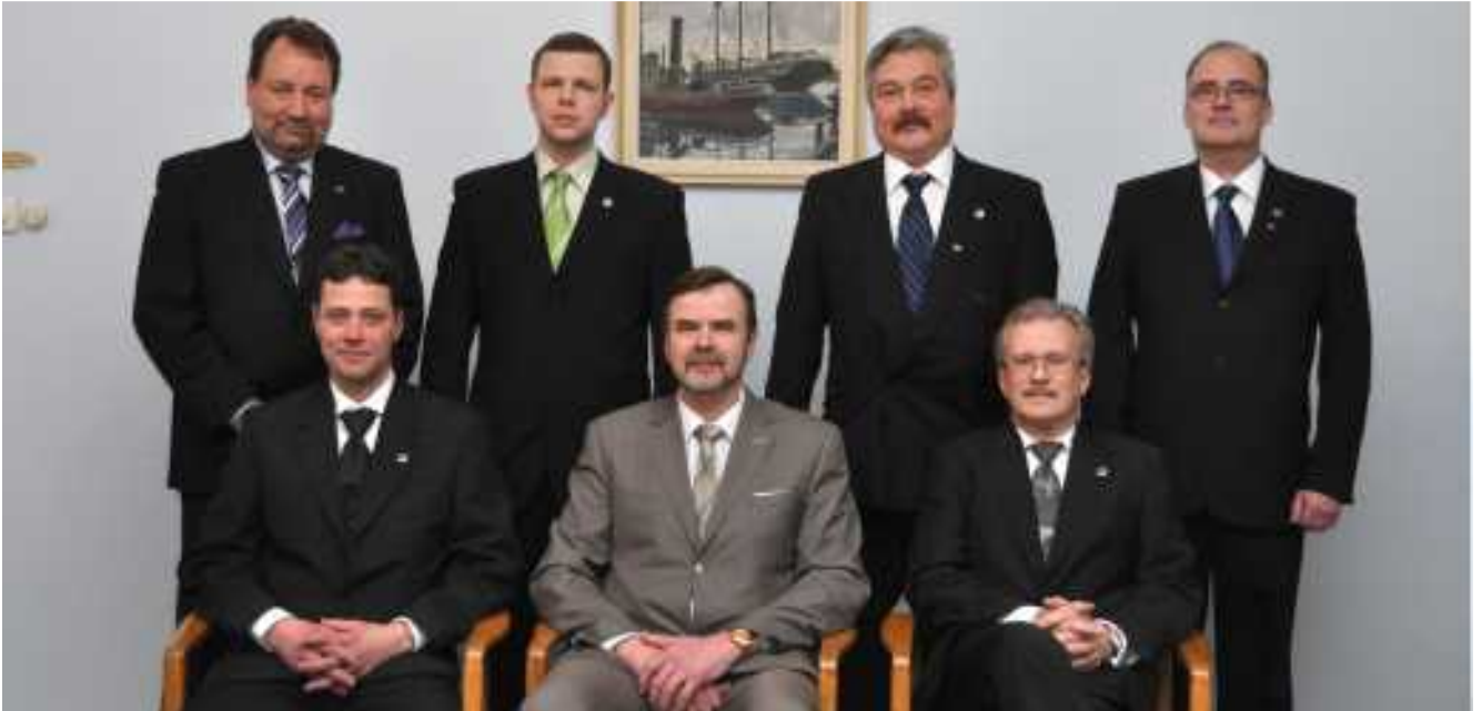
Porin Metsästysseuran johtokunta 2010