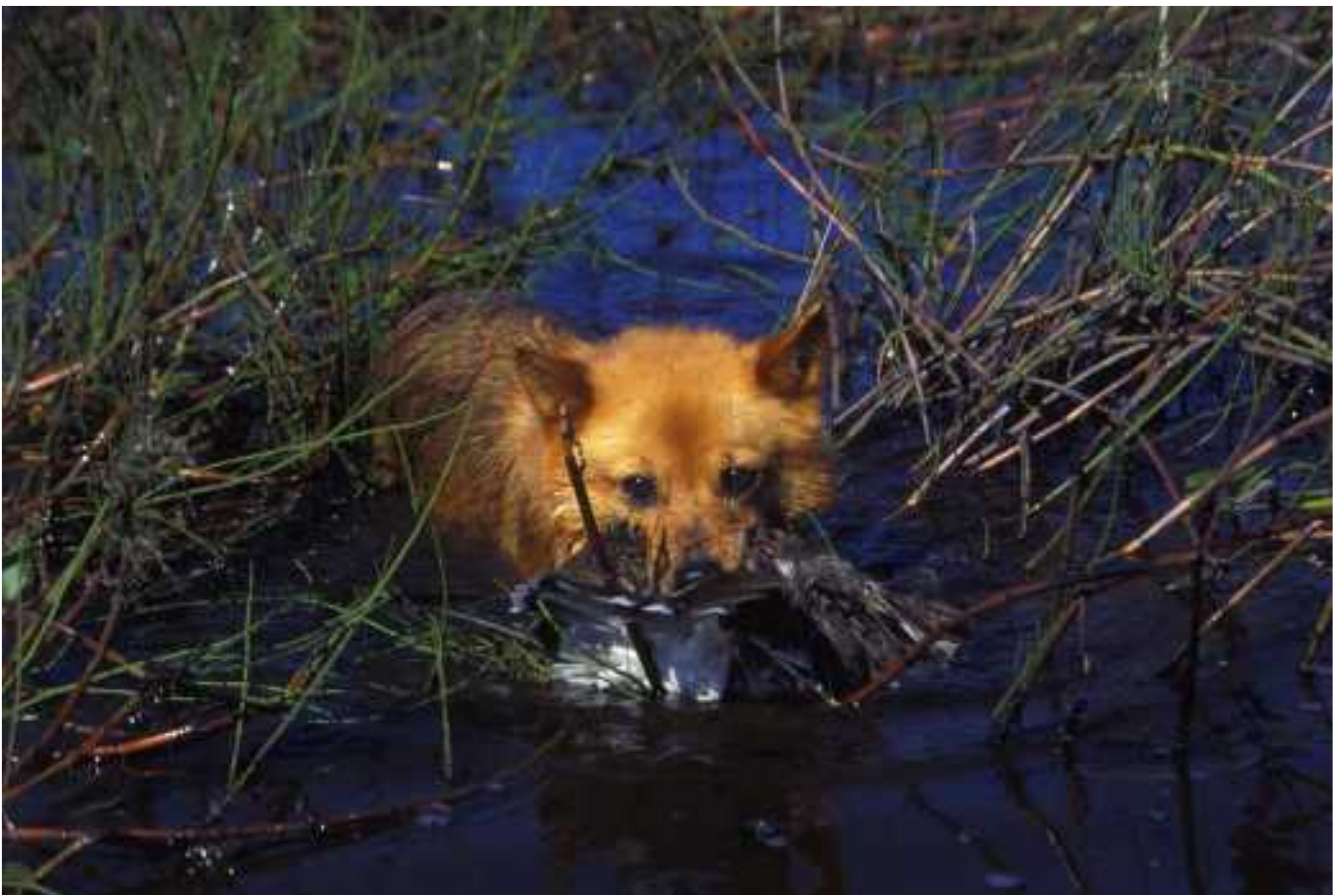
Nippe noutaa.