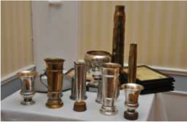
Kunniakirjojen ja kiertopalkintojen saajat vuonna 2010: