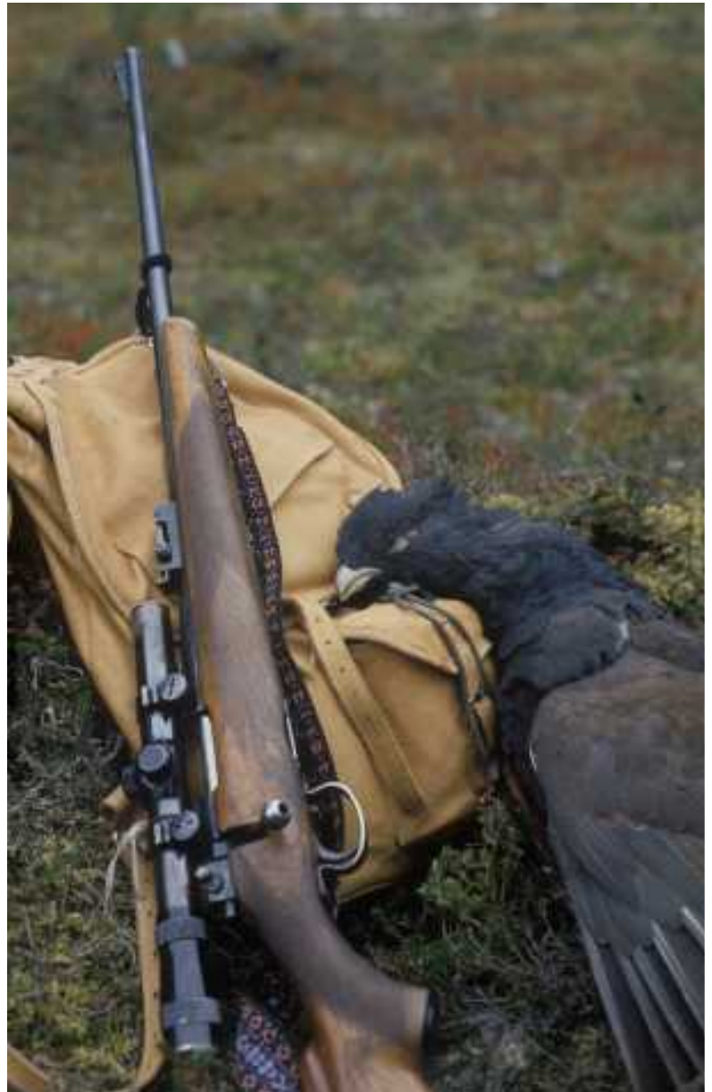
Karhunevan homenokka.

Radiopuhelin pärähti korvassani jahtipäällikön äänellä. -Juu voidaan panna tämä ajo poikki. Ollaan jo kohta Karhunevan aukon ylitettyämme tiellä, vastailin ajatuksistani heräten..