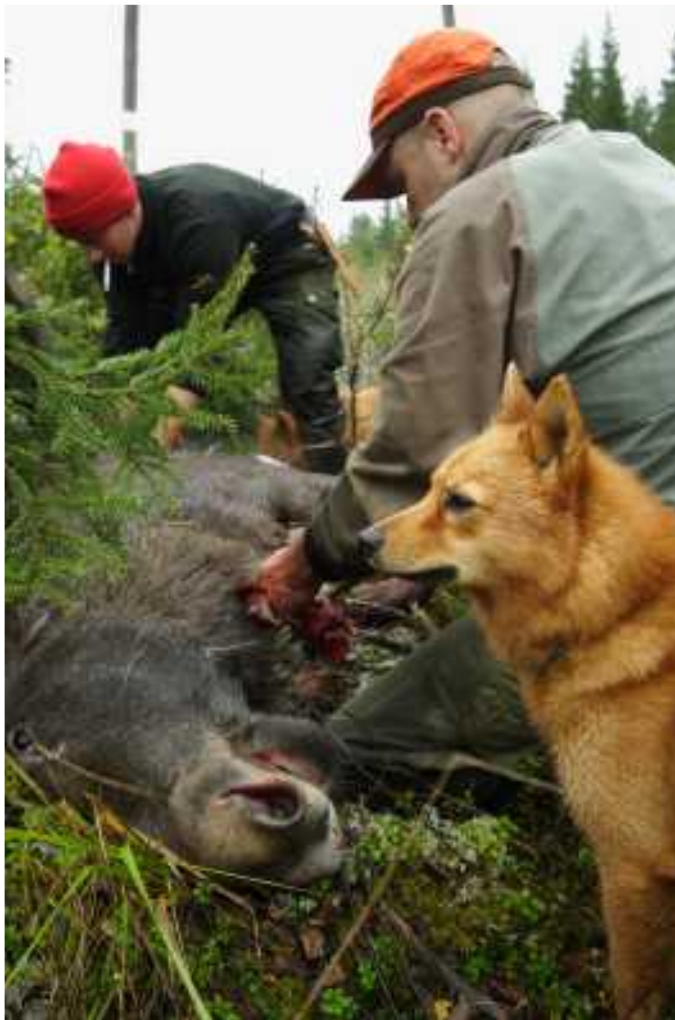
Tyytyväisiä metsästäjiä.