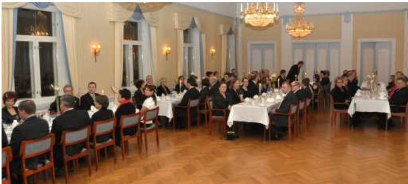
120-vuotisjuhlailla vietettiin hyvän ruuan ja tanssin merkeissä mukavassa seurassa.