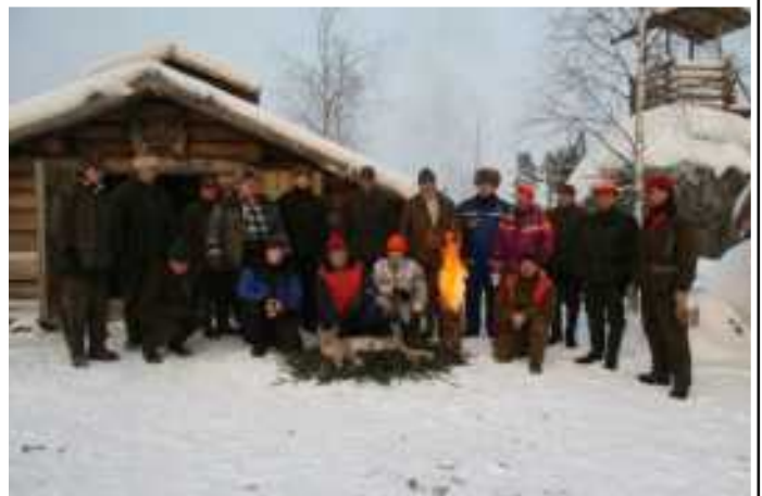
Onnistunut ilvesjahti Noormarkun Erämiesten jahtimailla.

Vuoden 2010 metsästys aloitettiin ilvesjähdillä vuosikymmenten tauon jälkeen. Pyyntiluvan hakivat Noormarkun Erämiehet, A.Ahlström Oy ja Porin Metsästysseura yhteisellä hakemuksella. Jäsenemme osallistuivat yhteisiin jahteihin, mutta jahtiseurue onnistui saamaan kaadon vasta lauantaina 30.1. jolloin emme juhluvuoden vuosikokousjärjestelyjen takia olleet jähdissä edustettuina. Mukavat muistot jäivät yhteisistä jahtiretkistä mieleen. Ilveskanta on siinä määrin kasvanut, että jatkossakin pyyntilupia saataneen kannanhoidollisin perustein yhteisellä hakemuksella.