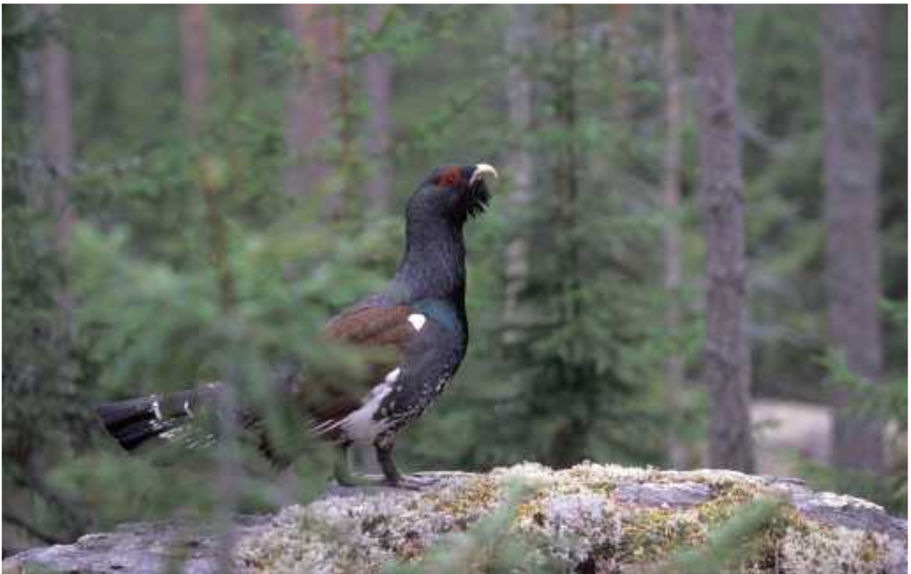
Karhunevan valtakukko.

Karhunevan komeissa maisemissa alkoi kimakka haukku. Haukku raikui niin, että ihmetellä piti missä välissä henkeä vedetään. Nopeasti repu pois selästä. Matkaa ei ollut montaa sataa metriä. Nöyränä kontaten etenin kuusenpersauksesta toiseen. Ryömein ahteelta alas notkoon ja viereiltäni karkasi toinen musta metso. Painoin pään