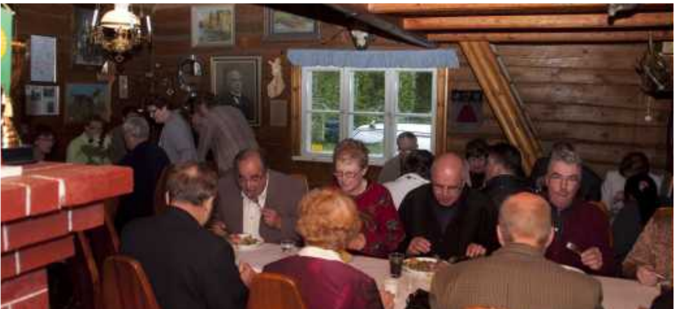
Maanomistajien juhla Metsolassa 2010.