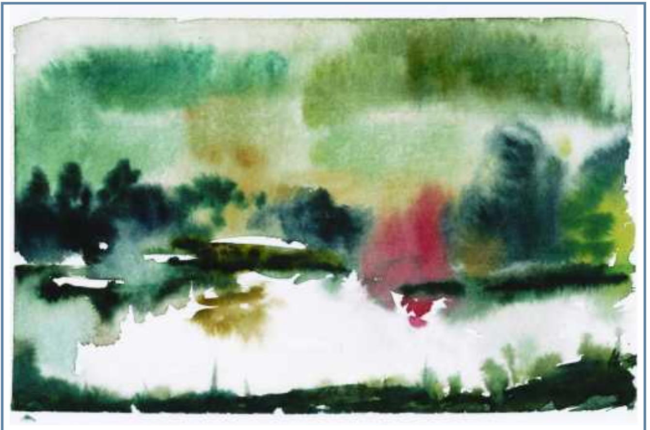
Metsälammen fantasia, akvarelli Mariitta Vaalahti

Syksyn parhaan hirvipassin sain, Nälkälammin rantamailta.